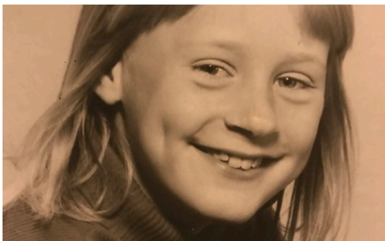
MIG SOM 9 ÅRIG.

Jeg havde mange stunder, hvor jeg måtte fylde tiden ud - vi havde ikke fjernsyn og bussen gik nærmest aldrig - og til sidst gik den slet ikke. Jeg havde mit klaver, og på et tidspunkt fik jeg en 4 spors båndoptager. Så jeg drømte mig væk i musikken. Jeg måtte også finde frem til ligesindede på de nordfynske sletter, og det lykkedes da både at lave en teatergruppe og komme med i et børnerockorkester . ( Dog i Odense)